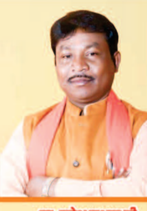
मा. महेश कश्यप जी सांसद बस्तर लोकसभा क्षेत्र