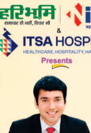
श्री आकाश छिकारा कलेक्टर - बस्तर